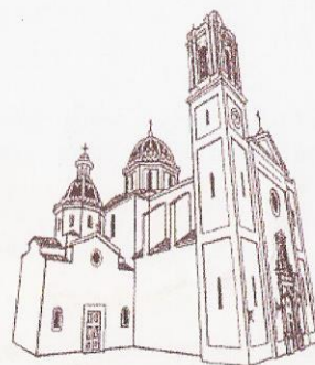
Parroquia Ntra. Sra. del Consuelo