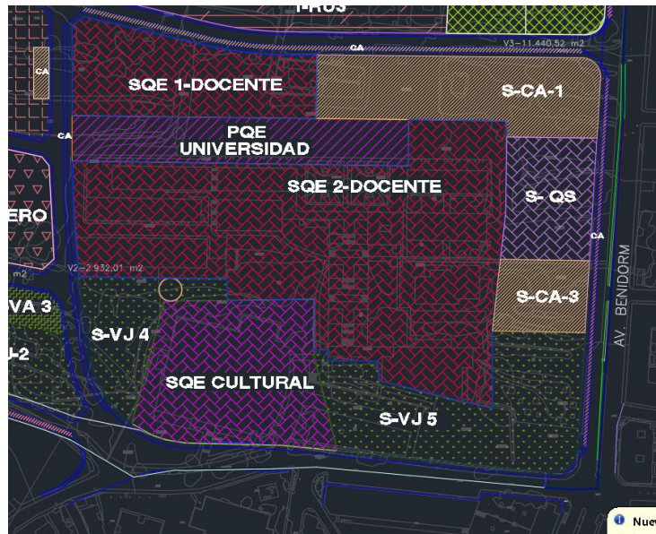
Detalle de ubicación de las nuevas parcelas dotacionales S-QS y S-CA-3. Ordenación de acuerdo con la modificación

De tal modo que se genera una nueva parcela denominada S-QS destinada a uso asistencial con una superficie de 2.942,70 metros cuadrados, y como consecuencia se modifica la superficie de la parcela de uso de aparcamiento S-CA-1 que pasa a tener 5.303,67 m 2 y se genera una nueva parcela S-CA-3 también con uso de aparcamiento y con una superficie de 1.774,22 metros cuadrados localizada entre la S-QS y la S-VJ5, con fachada a la Avenida Benidorm.